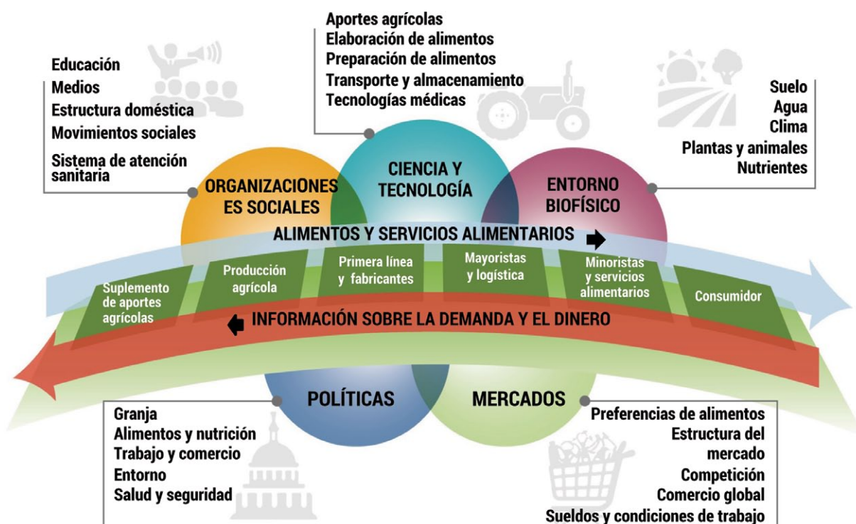
Figura 1. Marco par evaluar los efectos del sistema alimentario